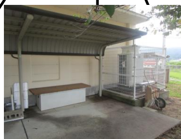
防災かまど（応急救急栓備品も入っている）