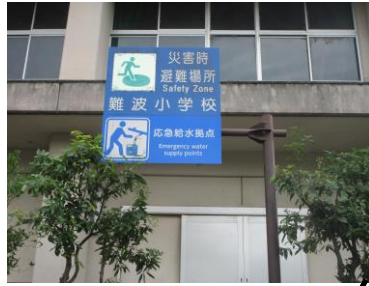
災害時避難場所等表示