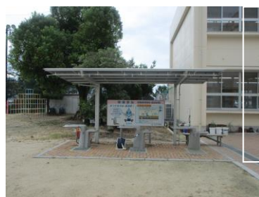
のめるん 飲料水用蛇口