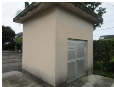
避難所開設時使用物品保管所①