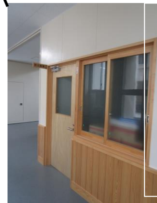
避難所開設時使用物品保管所②