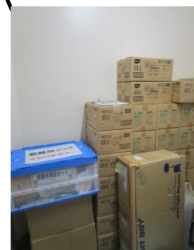
マンホールトイレ設置 用備品保管場所