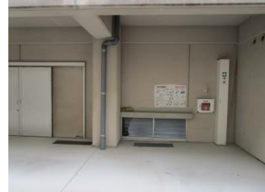
体育館南入口 A E D 設置場所