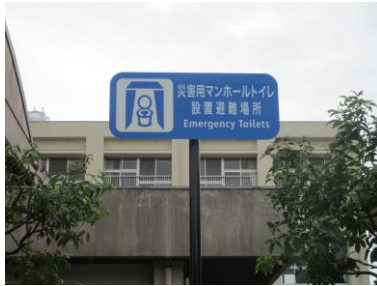
災害用マンホールトイレ設置表示板

□ 松山市からの避難所開設依頼を受けて、地域自主防災と学校が連携して、避難所開設を行います。