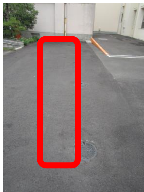
マンホールトイレ設置場所（6基）